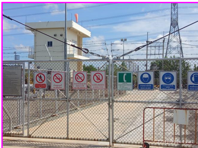
ป้ายเตือนต่าง ๆ บริเวณสถานีควบคุมความดันก๊าซ (MRS)