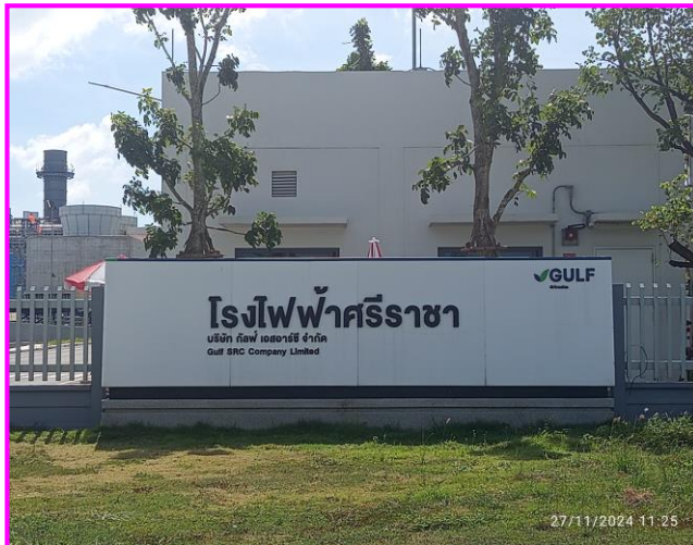
บริเวณด้านหน้าโรงงาน