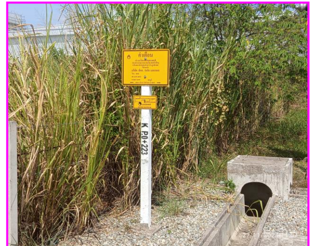
ป้ายเตือนแนวท่อส่งก๊าซฯ บริเวณโรงงาน