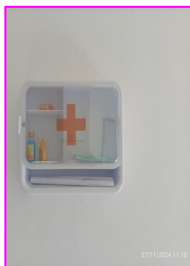
อุปกรณ์ปฐมพยาบาล