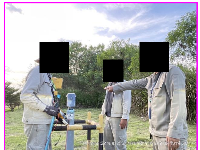
พนักงานสวมใส่ชุด PPE