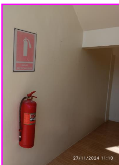
ถังดับเพลิงบริเวณท่อส่งก๊าซฯ