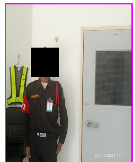
เจ้าหน้าที่รักษาความปลอดภัย

ภาพที่ 3.2-15 ภาพถ่ายระบบรักษาความปลอดภัยตามแนวท่อส่งก๊าซฯ และบริเวณสถานีก๊าซฯ ของโครงการทอส่งก๊าซธรรมชาติไปยังโรงไฟฟ้าศรีราชา